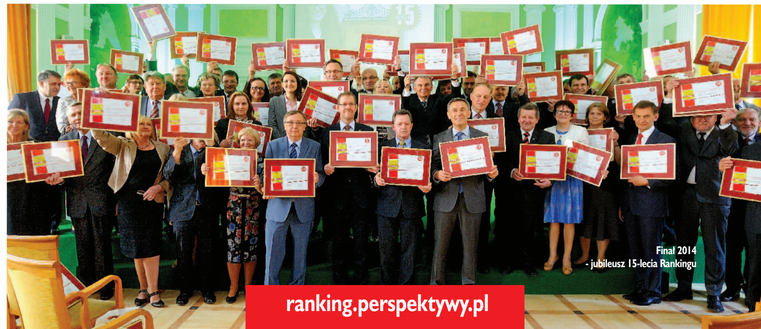
Final 2014 - jubileusz 15-lecia Rankingu