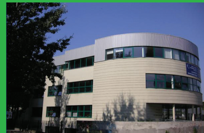
Szkoła Wyższa Przymierza Rodzin w Warszawie