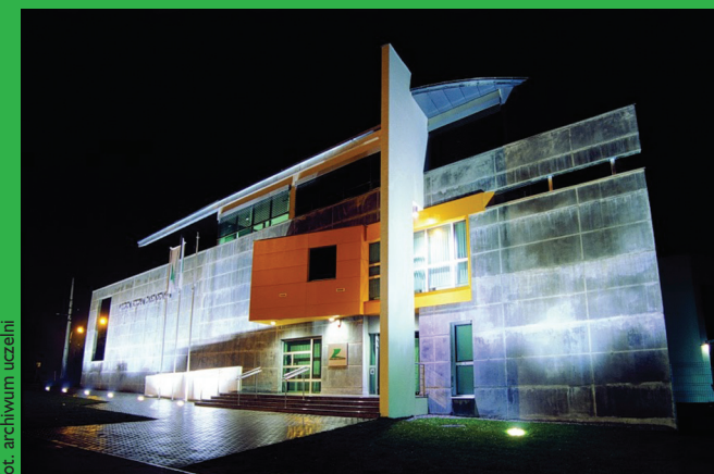
Wyższa Szkoła Zarządzania w Gdańsku