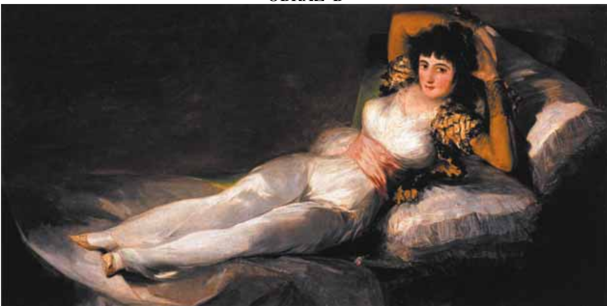
Francisco Goya, Maja ubrana , 1801–03, olej na płótnie, 95 x 190 cm