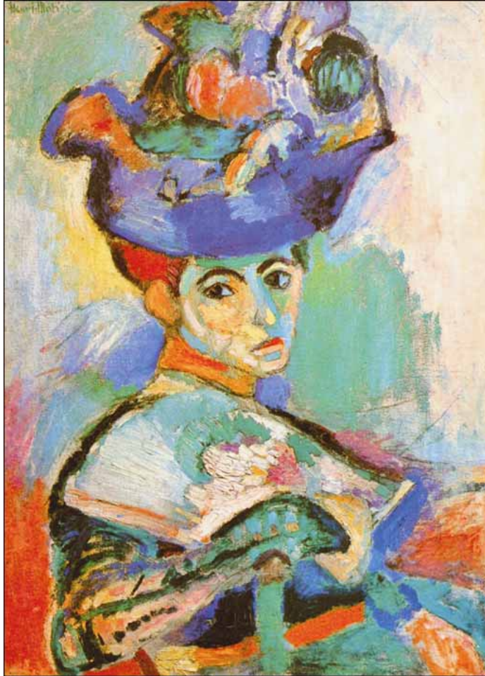
Henri Matisse, Kobieta w kapeluszu , 1904–05, olej na płótnie, 79,4 x 59,7 cm